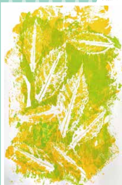
葉っぱの多色版画