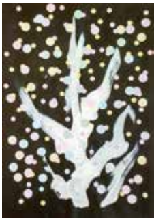
樹木のシールアート