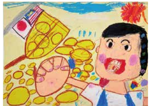
玉入れがんばったよ