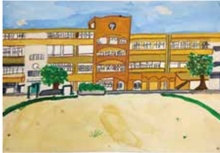
遠くから見た北中学校