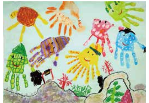
楽しくおもしろい海

自由で創造力あふれる子どもたちの作品をご覧ください、アール・ブリュットを身近に感じてもらうことで子どもたちの作品への理解と関心が広がり、障がいのある子どもたちの表現活動がさらに未来へつながっていきますように。