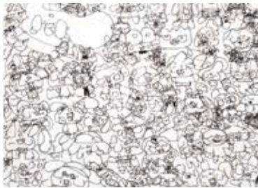
おきにいりキャラ、大集合!