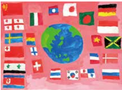
お気に入りの世界 世界の国旗