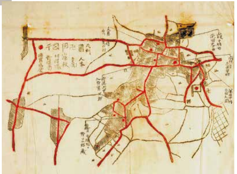
明治43年(1910)第3師団と第15師団による臨時対抗演習時の村内宿泊先