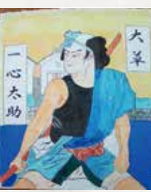
① 一心太助 ② 6.2畳