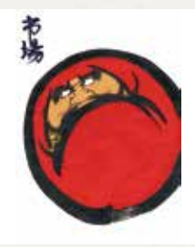
① 達磨 ② 7畳