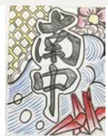
① 輝く南中 ② 4.5畳