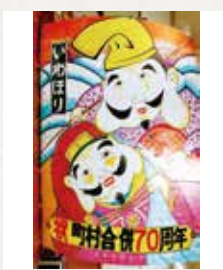
① 恵比寿さん 大黒さん ② 8畳