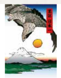
① 富士山 ② 6畳