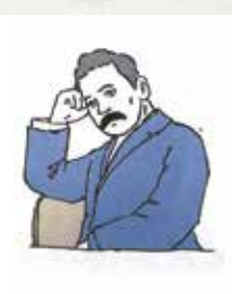
① 夏目漱石 ② 6畳