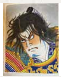
① 奥村助右衛門 ② 11.5畳