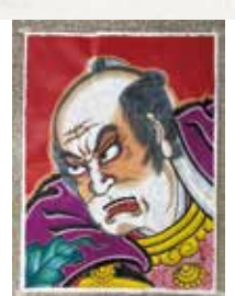
① 大久保彦左衛門 ② 8畳