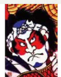
① 大高源吾 ② 8.5畳