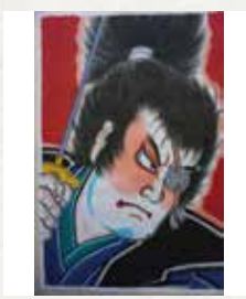
① 柳生十兵衛 ② 10.5畳