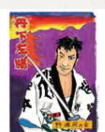
① 丹下左膳 ② 6畳