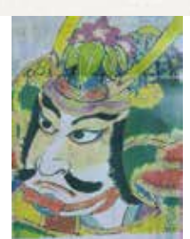
① 義経 ② 5畳