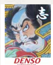
① 志 ② 12畳