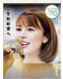
① こうたの空へ(半崎美子) ② 8.6畳