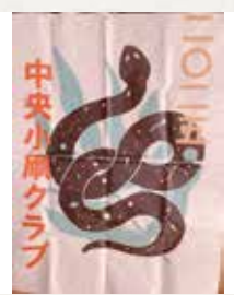
① 干支(へび) ② 2畳