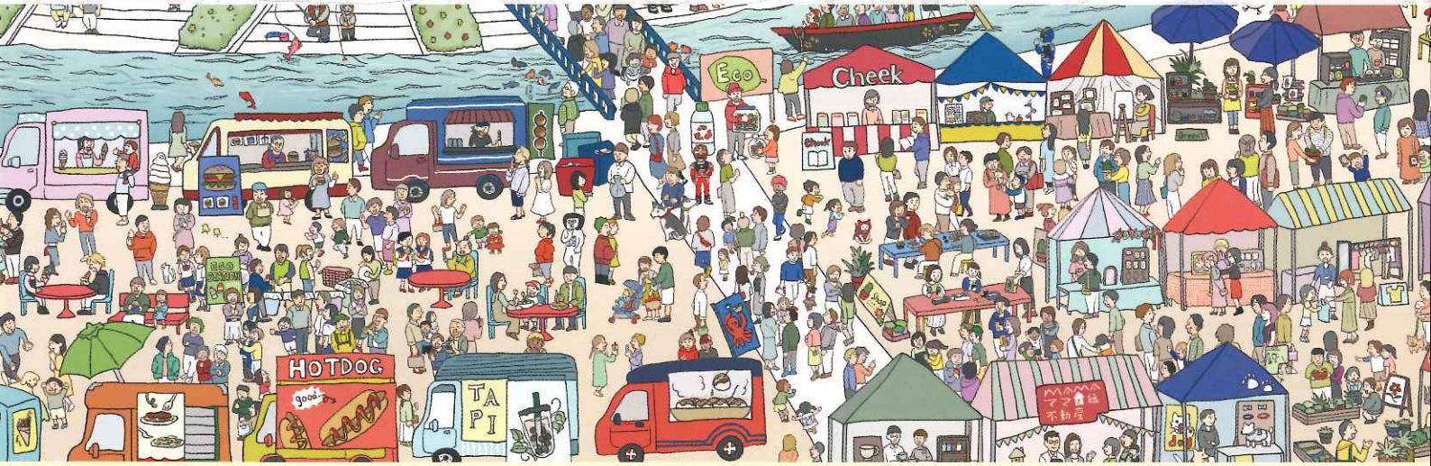
※イラストはイメージです