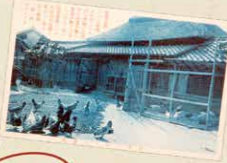
副業としての養鶏(農業絵葉書)