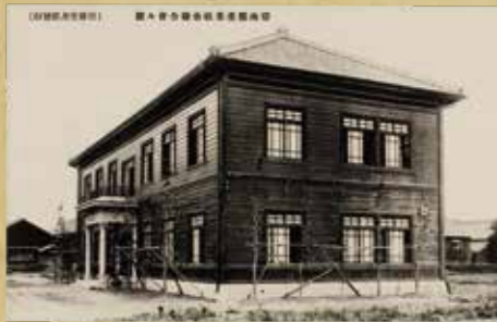
〔安城市歴史博物館〕 安城市農業協会の会館

令和七年 四月十九日(土) 六月二十九日(日) 〔休館日〕毎週月曜日 ※五月五日は開館 〔開館時間〕九時～十七時 ※入館は十六時半まで 大正期から昭和初期に 農業先進地として注目された 碧海郡は、農業で発展した デンマークと重ねられ、 「日本デンマーク」と 呼ばれました。