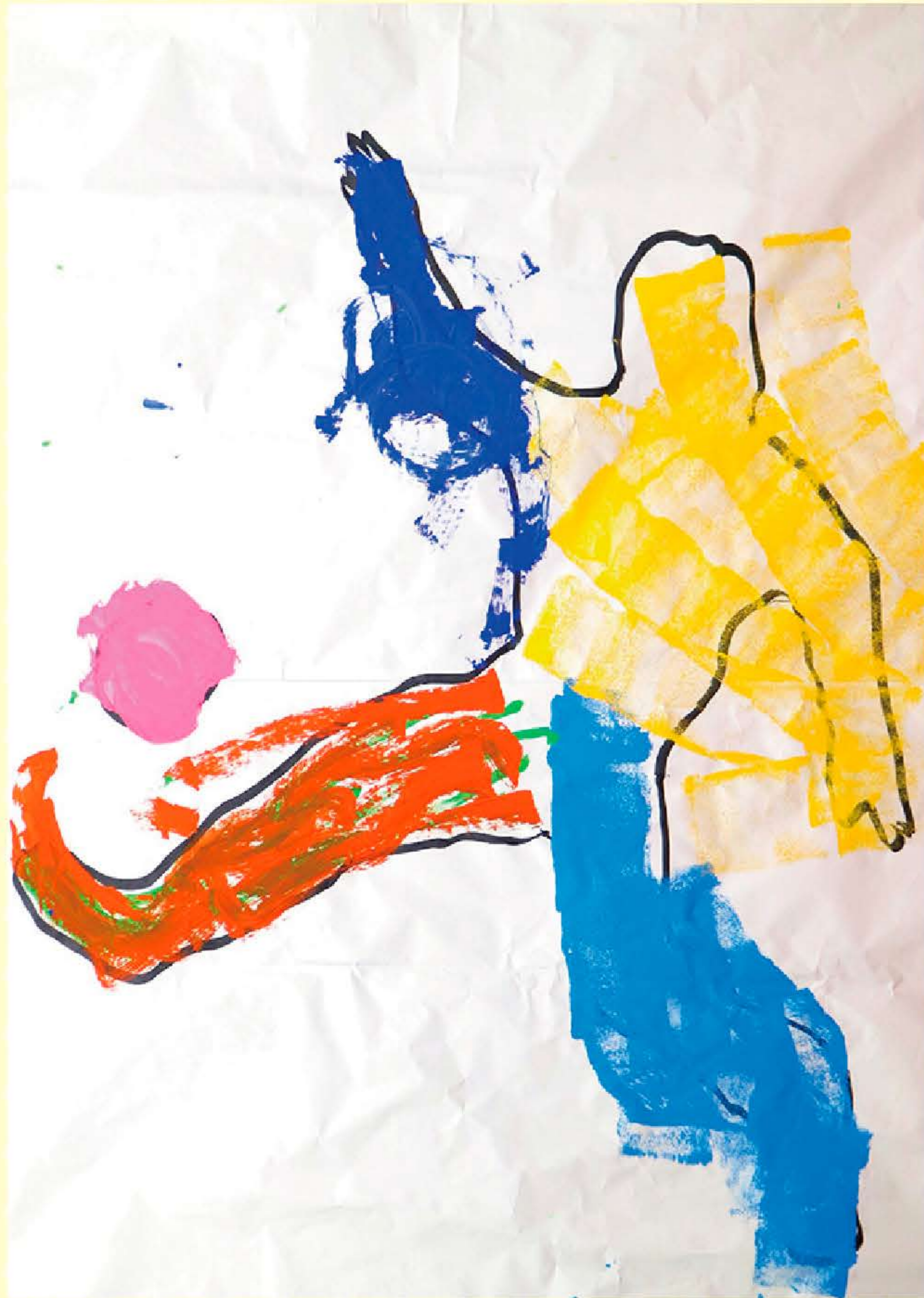
ちからいっぱいきっく