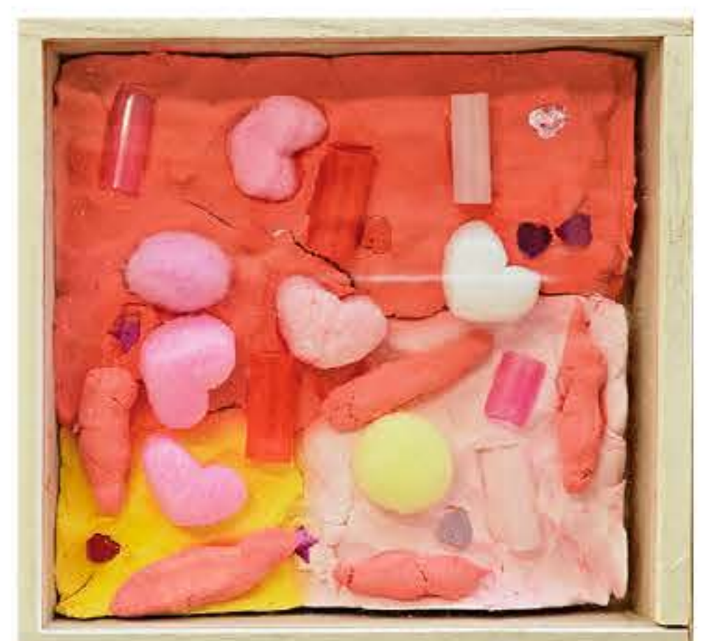
はーとがいっぱい