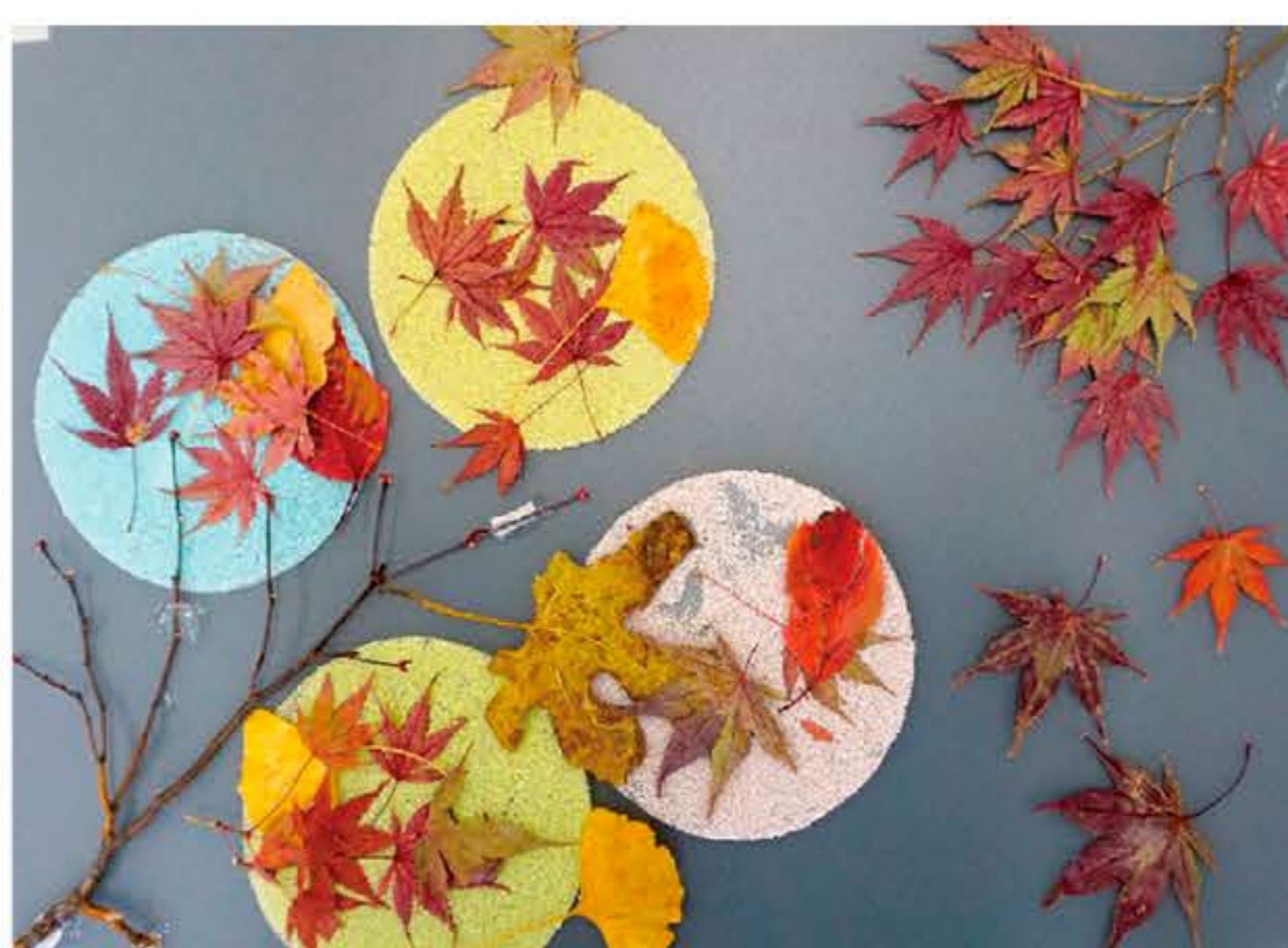
あきをひろったよ