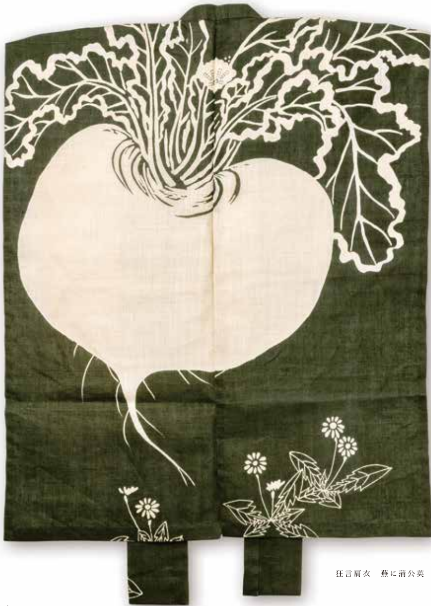
狂言肩衣 蕪に蒲公英