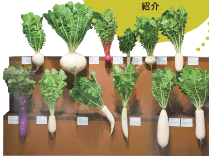
多彩な地ダイコン レプリカ 国立科学博物館