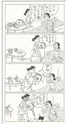
漫画「サザエさん」 (1956(昭和31)年6月13日、朝日新聞掲載) ©長谷川町子美術館