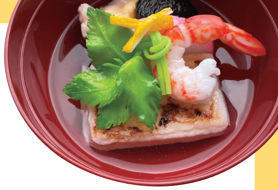
雑煮 レプリカ 制作協力：奥村起生監修 御食国若狭おばま食文化館

「和食」がユネスコ無形文化遺産に登録されて10年が過ぎ、世界中でますます注目の高まる和食を、バラエティ豊かな標本や資料とともに、科学や歴史などの多角的な視点から紹介します。日本列島の自然が育んだ多様な食材や、人々の知恵や工夫が生み出した技術、歴史の変遷、そして未来まで、身近なようで意外と知らない和食の魅力に迫ります。