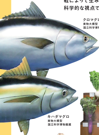
クロマグロ 実物大模型 国立科学博物館

食の基本となる水、そしてキノコ、山菜、野菜、海藻、魚介類といった世界でも有数の生物多様性を持つ日本列島がもたらした食材や、人々の食への飽くなき挑戦によって生み出された発酵の技術や出汁について、科学的な視点で解説します。