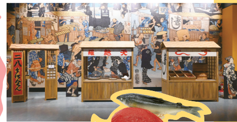
江戸時代の屋台の再現