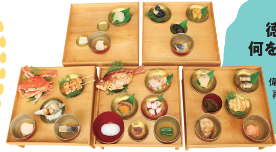
織田信長が徳川家康をもてなした本膳料理の再現模型 奥村起生監修 御食国若狭おばま食文化館

縄文時代から現代まで、人々の知恵やおもてなしの心、海外との交流を通じて発展してきた和食の歴史を紐解きます。