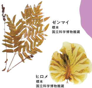
ゼンマイ 標本 国立科学博物館