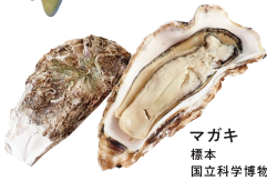
マガキ 標本 国立科学博物館