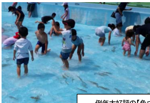
例年大好評の【魚つかみ&amp;塩焼き】