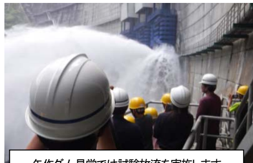
矢作ダム見学では試験放流を実施します